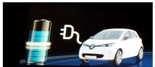
Display i bilen